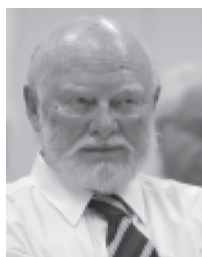
Ronald McKinnon, Stanford

Optimální měnovou oblast tvoří země, které jsou velmi otevřené obchodu a úzce mezi sebou obchodují