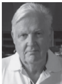
Robert Mundell, Columbia

Optimální měnové oblasti jsou takové oblasti, v jejichž rámci se lidi snadno pohybují